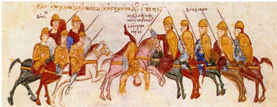
(Ο Θάνατος του Γρηγόριου Ταρωνίτη-Μικρογραφία του Ιωάννη Σκυλίτζη)

Ο Γρηγόριος Ταρωνίτης ήταν πρίγκιπας της Νότιας Αρμενίας (περιοχή Ταρών). Προσέφερε τις υπηρεσίες του στον Βασίλειο Β΄ στην αντιμετώπιση των επαναστάσεων των δυνατών, Βάρδα Σκλήρου και του Βάρδα Φωκά στη Μικρά Ασία. Αργότερα απέκτησε το αξίωμα του διοικητή (μάγιστρου) της Θεσσαλονίκης. Το 996 ο βούλγαρος ηγεμόνας Σαμουήλ επιτίθεται στη Θεσσαλονίκη, νικά τους βυζαντινούς και ο Γρηγόριος Ταρωνίτης πέφτει νεκρός στη μάχη.