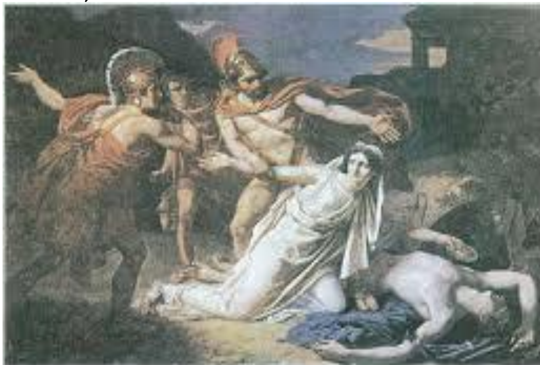
15. S.L.W. Norblin de la Gouldaine, Η Αντιγόνη συλλαμβάνεται, ενώ ρίχνει γόους στον νεκρό Πολυνείκη . 1825. Ήλιθογραφία. Παρίσι, Εθνική Σχολή Καλών Τεχνών.

Κάτζερ ( Antigone oder Die Stadt , 1991).